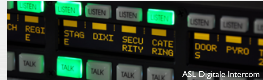
ASL Digitale Intercom